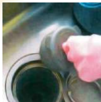
硫化水素 (排水ロートル臭など)