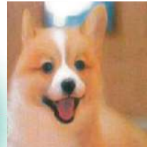
モニア (ペット臭など)