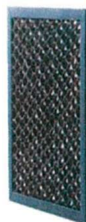
活性炭フィルター