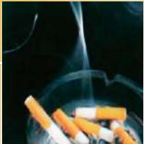
アセトアルデヒド (タバコ臭など)