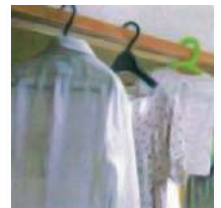
イソ吉草酸 (体臭 部屋干し臭など)