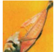
トリメチルアミン (魚の腐敗臭など)