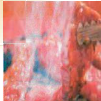
インドール イノパレルア デヒ (肉を焼いた時の オイなど)