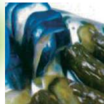
イソ吉草酸 (古漬のニオイなど)