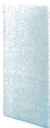
光触媒フィルター